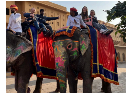
Elefantenritt Fort Amber

Wir besuchten die Gedenkstätte für Mahatma Gandhi, einen Sikh Tempel, den wir nur barfuß besichtigen durften und machten eine Rikscha-Fahrt durch das orientalische Treiben in den Gassen von Alt Delhi.